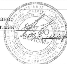
ГРАФИК практик на 2017-2018 учебный год