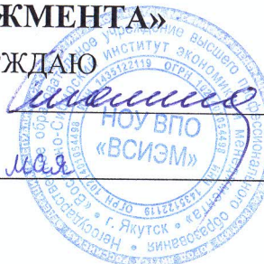
График учебного процесса высшего профессионального образования на 2013-2014 учебный год